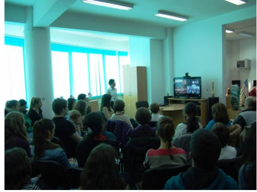
Activități desfășurate la sediul central al bibliotecii