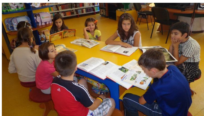
Activități organizate la sediul central