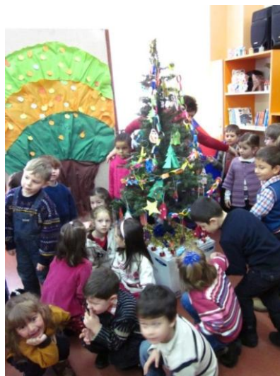
Activități organizate la Filiala „Traian Brad”