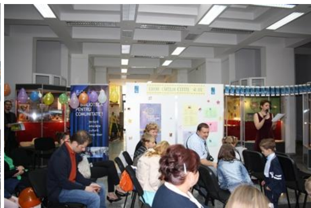
Festivitatea de premiere a concursului „Eroii Cărților citite” - 40 de ani