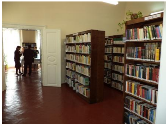
Inaugurarea Filialei Kogălniceanu - 3 octombrie

- A fost inaugurat serviciul de internet pentru public, prin programul Biblionet, la sediul central, Filiala Mănăștur, Filiala Kogălniceanu și Filiala Bibliosan.