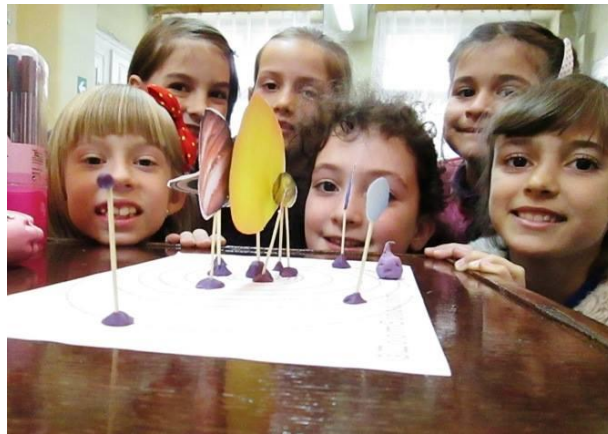
Activități organizate în săptămâna „Școala altfel”