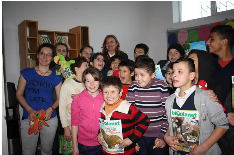
Lansare Minibiblioteca la Școala CRDEII

Proiectul Implică-te și dăruiește! Fii Voluntar! se derulează în cadrul proiectului național „Raftul cu inițiativă” implementat de Pro Vobis – Centrul Național de Resurse pentru Voluntariat, în parteneriat cu Asociația Națională a Bibliotecarilor și Bibliotecilor Publice din România (ANBPR), în perioada mai 2014 - iunie 2015. În cadrul acestui proiect, în 5 decembrie 2014, cu ocazia Zilei Internaționale a Voluntarilor, a fost inaugurată prima minibibliotecă la internatul Școlii CRDEII, aceasta cuprinzând cărți, reviste, materiale audio-video și jucării.