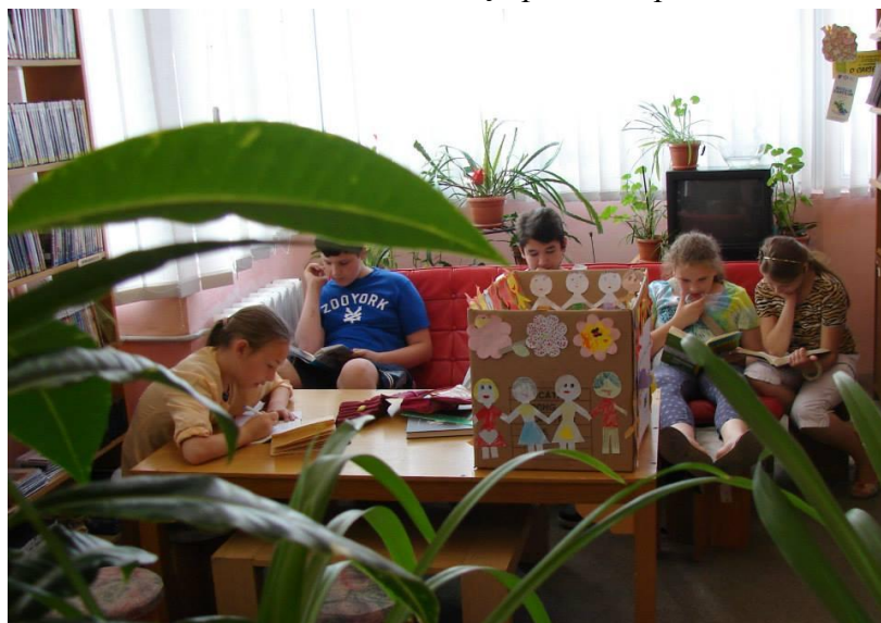
Vacanța la bibliotecă