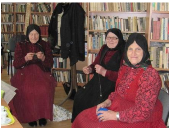
Promovarea tradițiilor populare – șezătoare la Biblioteca Comunală Sic