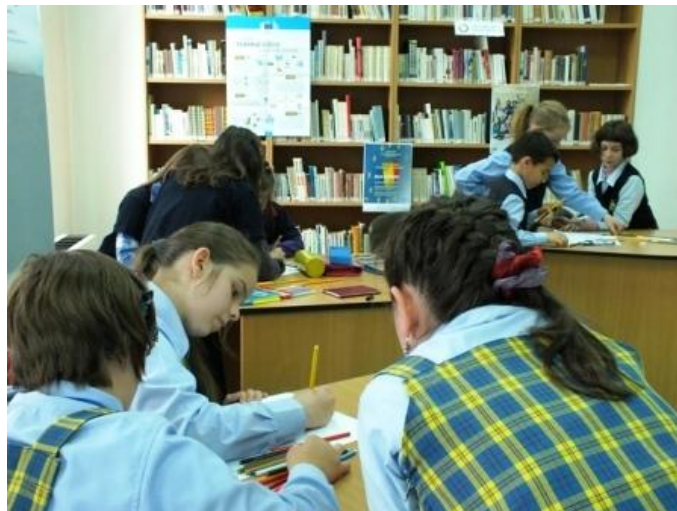
14 mai 2014 Ziua Europei - Concurs de desen pentru elevi din clasele I-IV

Ediția din anul 2014 s-a desfășurat sub genericul “Sunt cetățean european responsabil!”. La concursuri au participat 54 de elevi din învățământul preuniversitar clujean.