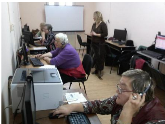
Cursuri pentru seniori la Biblioteca Municipală Turda