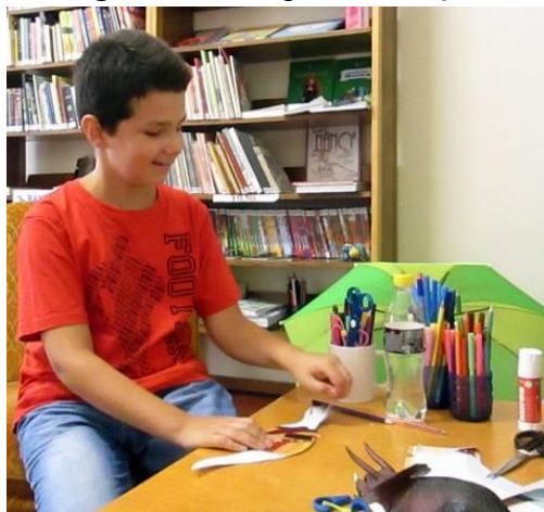
Atelier de bricolaj