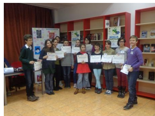
Finala Bătăliei Cărților la secțiunea Copii