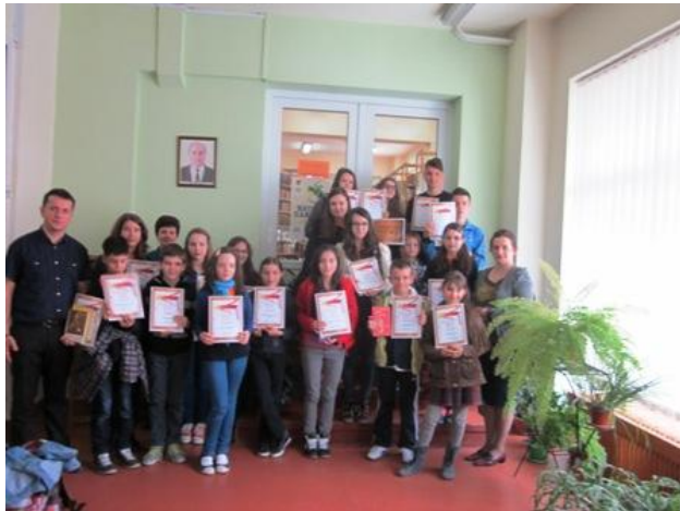
Concursul „Micii creatori”, ediția a XI-a, 23 premianți

Situată în cartierul Mănăștur este cea mai mare filială de cartier a bibliotecii.