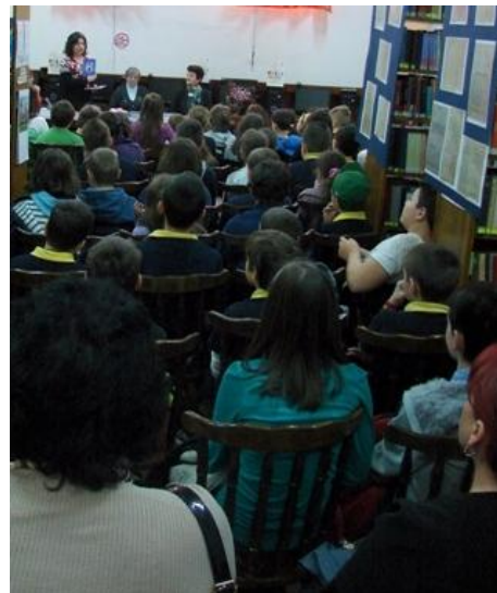
Ziua mondială a cărții pentru copii