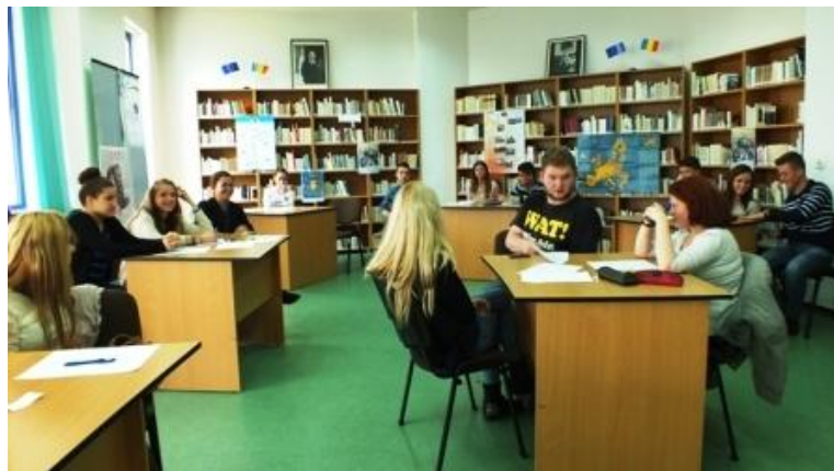
16 mai 2014 Ziua Europei - Concurs de eseuri pentru elevi de liceu