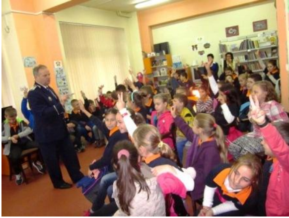
Activități organizate în parteneriat cu Inspectoratul Județean de Poliție Cluj