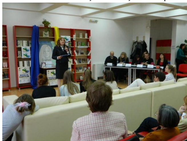
Finala Bătăliei Cărților la secțiunea Adolescenți