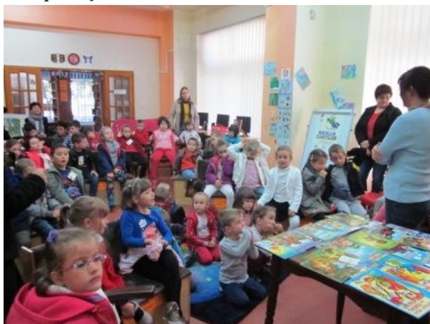
Zilele Bibliotecilor de cartier – septembrie 2014