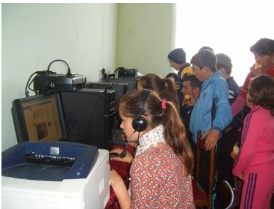
Accesarea Internetului la Biblioteca Comunală Buza