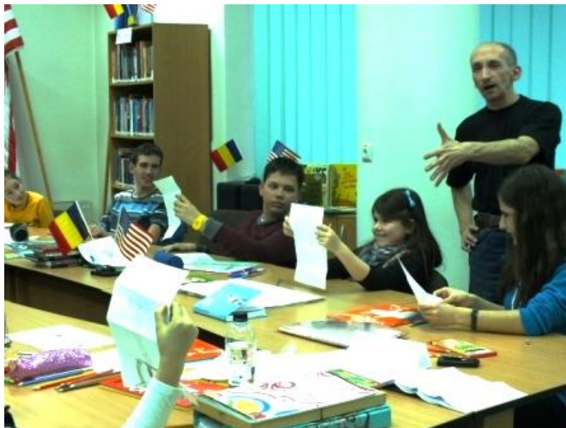
Intalnire a atelierului de grafica pentru copii și tineri