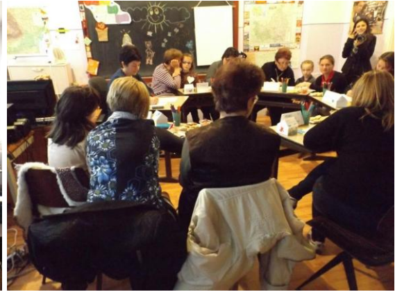
Ateliere intergeneraționale la Biblioteca Comunală Luna