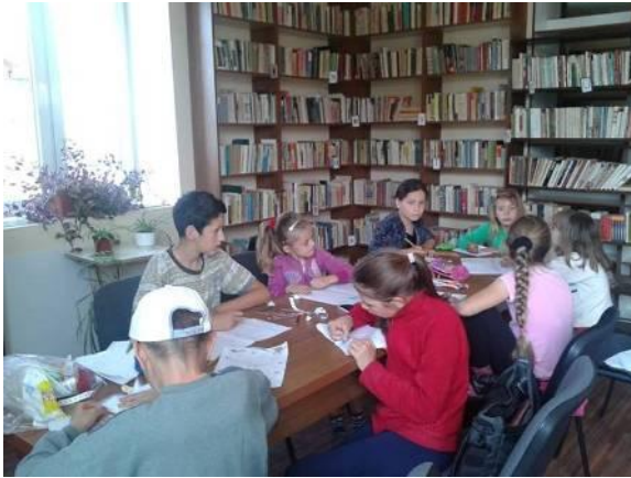
Ateliere cu copiii la Biblioteca Comunală Jucu