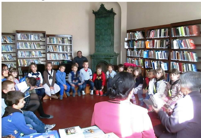
Lansare de carte