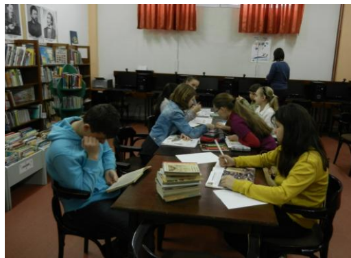
Tema pentru acasă o facem la bibliotecă