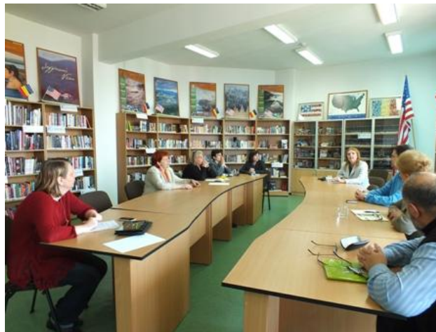
Focus group organizat cu factorii interesați

Rezultatul tuturor acestor demersuri este documentul “Strategia de dezvoltare a sistemului de biblioteci publice din județul Cluj 2015-2020”, cu anexele aferente, ce includ viziunea, misiunea, obiectivele strategice și specifice sistemului bibliotecilor publice din județul Cluj, măsurile corespunzătoare și portofoliul de proiecte propus de parteneri, ce au fost înaintate spre aprobare Consiliului Județean Cluj. Documentele sunt publice pe pagina web a bibliotecii.