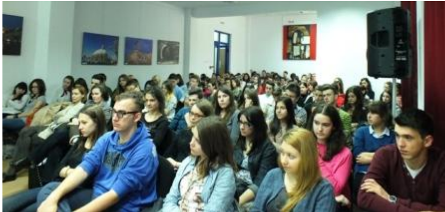
17 martie 2014 Prezentare a oportunitatilor de studii in SUA

Noël Carroll, City University of New York, desfășurată în cadrul conferinței internaționale “Arts and its context: cross-disciplinary dialogue” organizată de Universitatea “Babeș-Bolyai” (5 septembrie 2014).