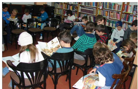
Vizite la bibliotecă