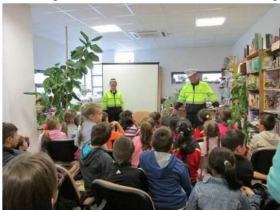
Activități în colaborare cu Poliția Română la Biblioteca Comunală Florești