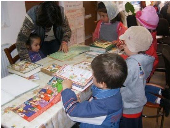
Activități în săptămâna „Școala Altfel” la Biblioteca Comunală Unguraș