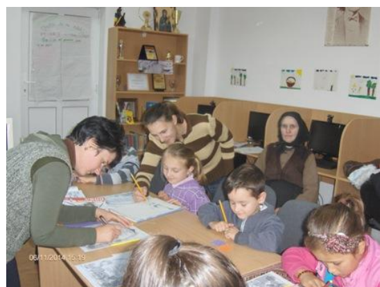
Ateliere intergeneraționale la Biblioteca Comunală Cămărașu