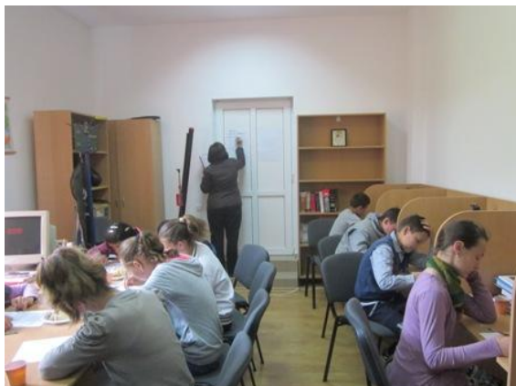
Cursuri de educație civică la Biblioteca Comunală Cămărașu

Inserăm, mai jos spre ilustrare, câteva fotografii de la câteva evenimentele culturale relevante organizate de bibliotecile publice din județul Cluj.