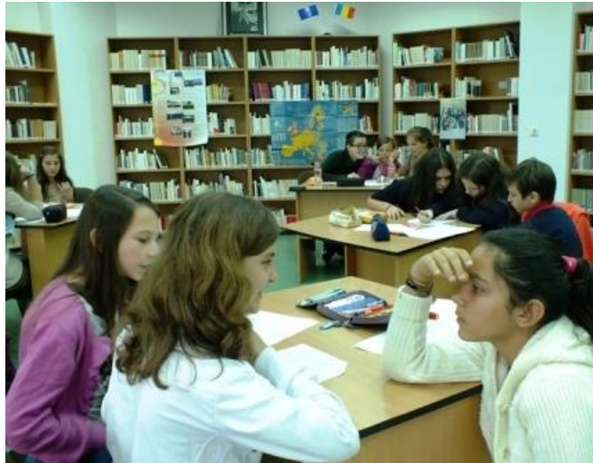
15 mai 2014 Ziua Europei- Concurs pentru elevi din clasele V-VIII