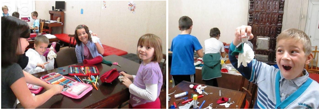
Programul „Personaj de poveste”