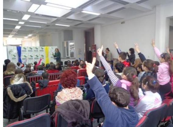
30 ianuarie 2014 - Lansarea concursului