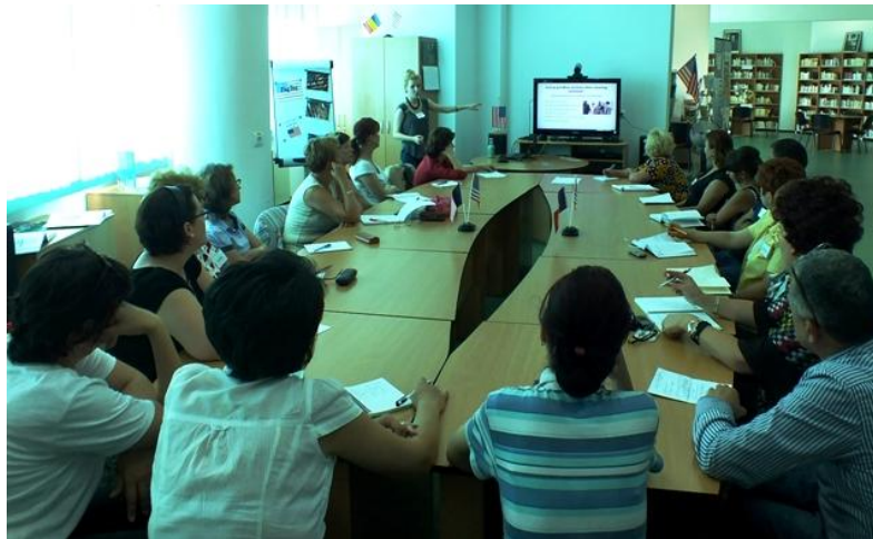
Întâlnire a clubului de conversație în limba engleză pentru adulți

Tabelul de mai jos cuprinde principalele proiecte cu finanțare externă derulate de bibliotecă în anul 2014.