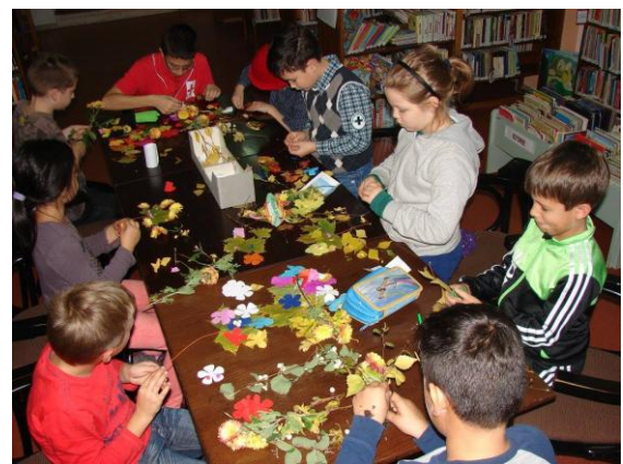
Ateliere de creație