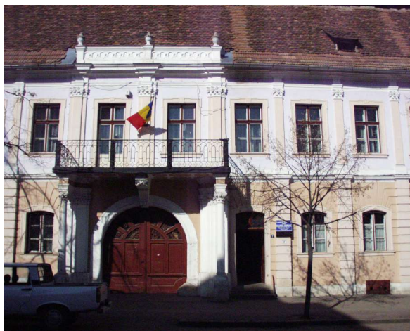
Filiala Kogălniceanu - Sala de lectură a bibliotecii și Compartimentul de referințe și bibliografii

Literatura de specialitate recunoaște importanța Serviciului de referințe din cadrul unei biblioteci, serviciu care ilustrează adecvat funcția bibliotecii de intermediar între informații și beneficiarii acestora. Se vorbește tot mai mult de funcția bibliotecii de a selecta, organiza și disemina informația având ca scop satisfacerea nevoilor informaționale ale utilizatorilor și, în acest sens, Serviciul de referințe joacă un rol primordial.